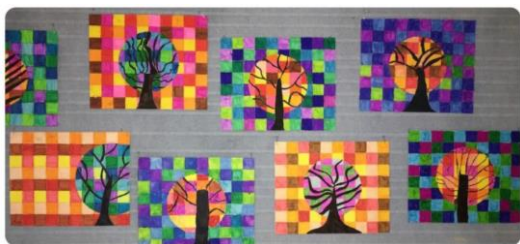
Figure 1 Chassillan, M. (2021). Les couleurs | CE2 | Fiche de préparation (séquence) | arts plastiques. Edumoov. https://www.edumoov.com/fiche-de-preparation-sequence/334839/arts-plastiques/ce2/les-couleurs

Următorul pas este să coloreze cercul cu culori calde în interior și culori reci în exterior sau invers. Alternați culorile după cum doriți, singura regulă fiind aceea că două pătrate de aceleași culori nu trebuie să se atingă.